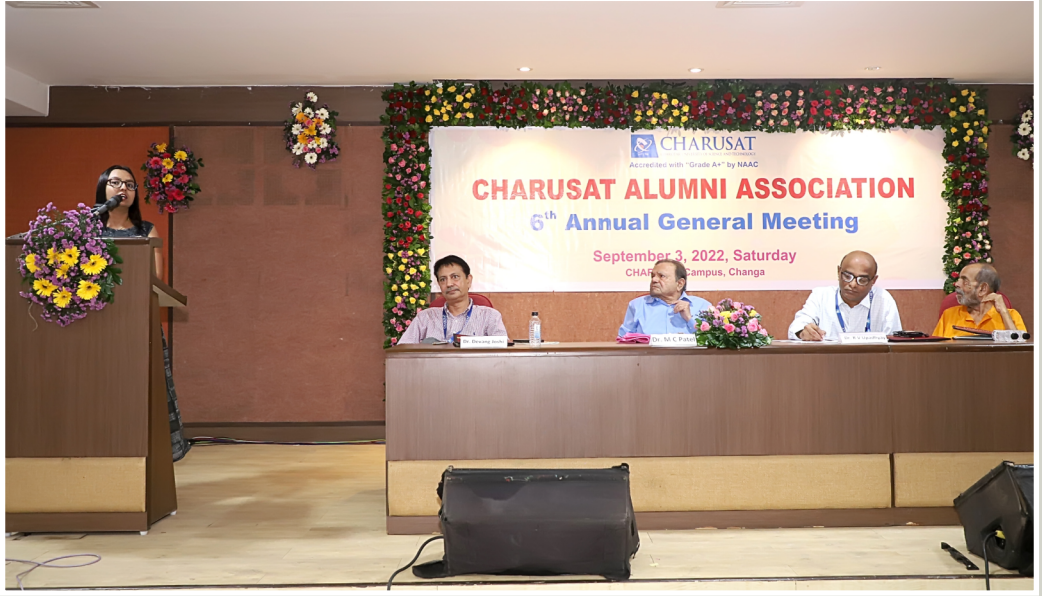
ચારુસેટ એલમ્ની એસોસિએશનની છઠ્ઠી વાર્ષિક સાધારણ સભામાં ડાયસ પર બિરાજમાન મહાનુભાવો

RNI New Delhi No. : GUJGUJ2015/65778 • Postal Registration No. : AND/349/2022-24 Date of Posting 15th of Every Month • Posted at V.V.Nagar Post Office