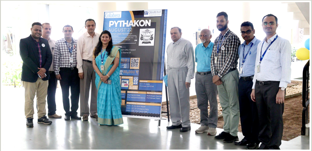
ચારુસેટમાં ૩૬ કલાક નોનસ્ટોપ નેશનલ લેવલની ઇવેન્ટ પાયથાકોનના ઉદ્ઘાટનમાં ઉપસ્થિત મહાનુભાવો